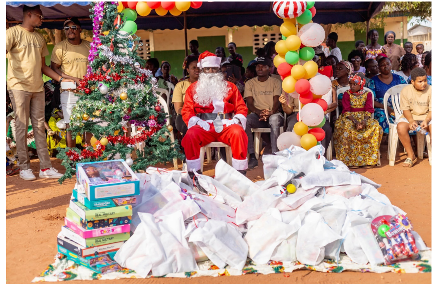
Noël Solidaire 2024 à Aboisso