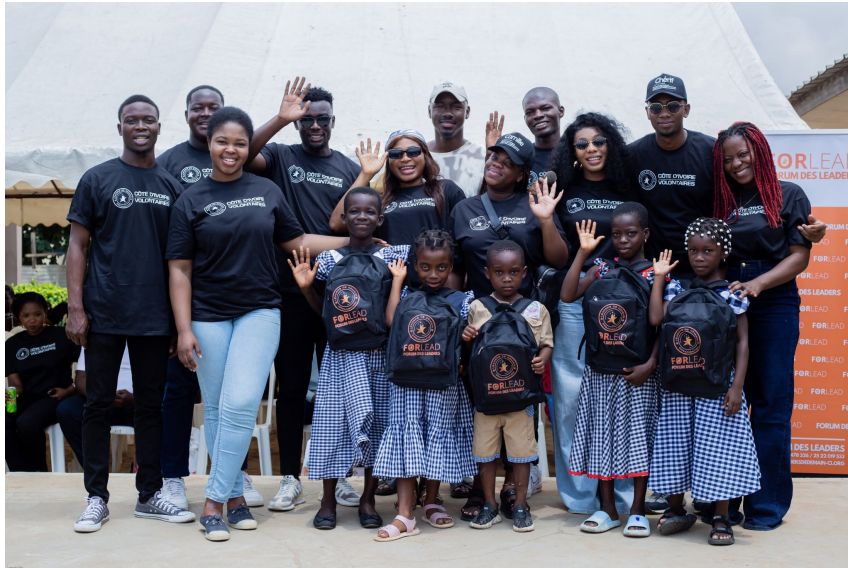
Solidarité Scolaire 2024 à Gonzague