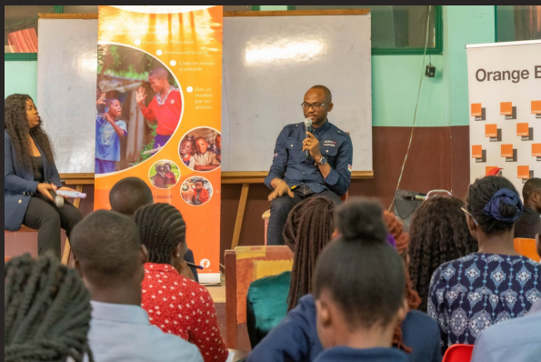
Université Catholique de l'Afrique de l'Ouest

Deux éditions de la Conférence Africa's Future Leaders Initiative organisées dans des universités de renom à Abidjan. Initiative portée par Leaders de Demain pour inspirer la prochaine génération de leaders africains